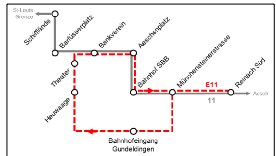
Abbildung 3: Geänderte Führung Linie E11

Zur besseren Entlastung der Linie 11 wird der Fahrweg der Linie E11 angepasst. Neu verkehrt die Linie E11 in der Innenstadt immer im Uhrzeigersinn. Zwischen Aeschenplatz und Münchensteinerstrasse verkehrt die Linie neu via Bahnhof SBB statt Denkmal. Nach dem befristeten Testbetrieb vom September 2020 handelt sich nun um einen unbefristeten Testbetrieb.