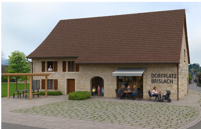
So könnte eine entsprechende Lösung aussehen, erstellt mit KI!